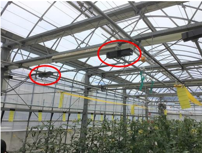
図1 磁歪材料による振動発生装置(東北特殊鋼株式会社製)をパイプに設置したトマト栽培施設(JA 全農内の展示圃場)